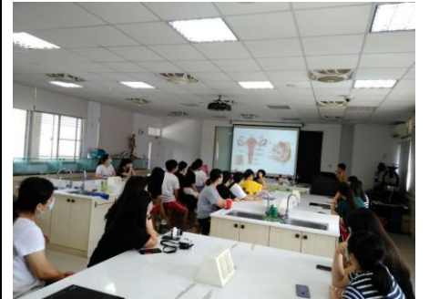
3-12 人體模型組裝比賽