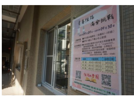
3-11 結合衛生單位愛滋宣導