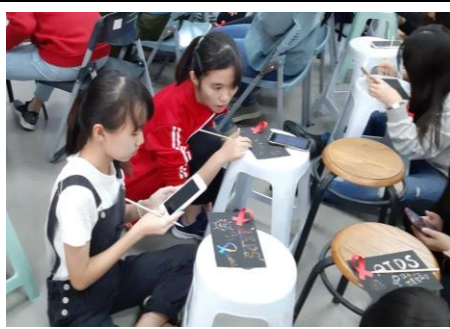
3-8 社團參與愛滋標語卡製作