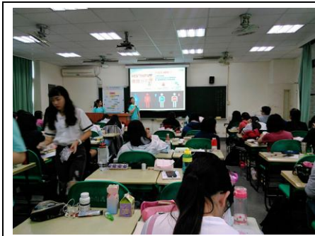
3-1 愛滋病防治入班宣導