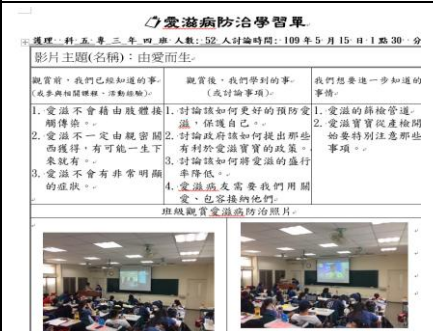
3-6 觀賞愛滋影片並完成學習單