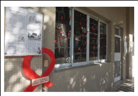
3-9 彩繪愛滋關懷卡展示