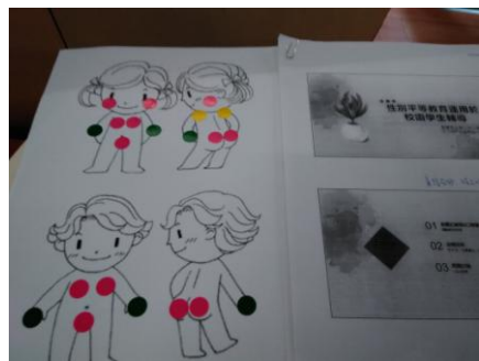
3-10 認識性平等及身體自主權