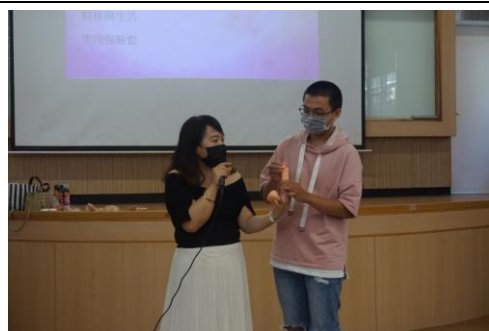
3-4 愛滋講座-保險套使用教學