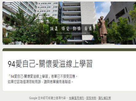
3-2 「94 愛自己-關懷愛滋」線上學習