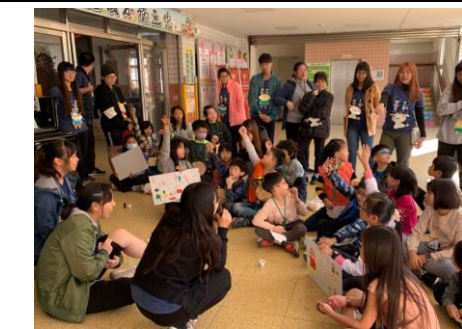
3-7 社團性教育宣導活動