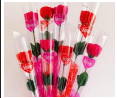
3-3 防疫愛之「康乃馨皂花」